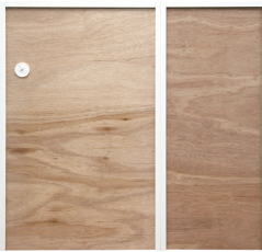
60Gと40DHを連結した裏面のイメージ