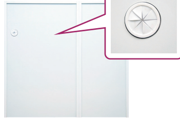
60Gと40DHを連結した裏面に化粧加工を施したイメージ