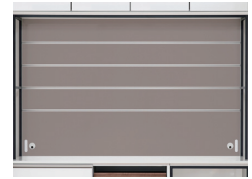
背板をB色に変えたイメージ